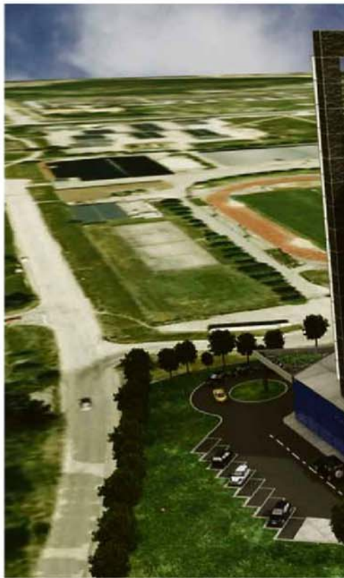
FÖRSLAG. Ett spa och närheten till Stockholm ska locka gästerna till