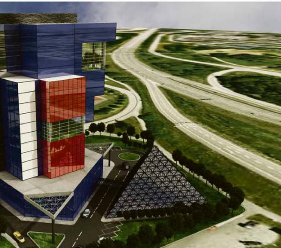
Hallunda centrum. Ritningen är bara ett förslag så exakt hur hotellet ska se ut är ännu inte bestämt.