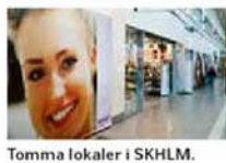
Tomma lokaler i SKHLM.

Snabbmatskedjan Burger King öppnar inom kort en restaurang i Skärholmens centrums foodcourt, vilket blir den första nyetableringen i SKHLM på länge. Centrumägaren Centeni AB ska under våren även presentera ett nytt koncept för modeplanet på övervåningen.